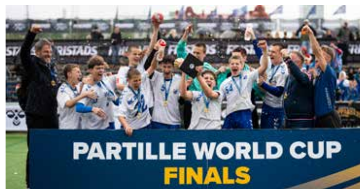
Winners B14 - RK Zagreb 1