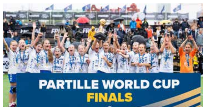
Winners G11 - HK Aranäs