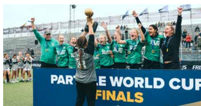
Winners G13 - Skanderborg HB 1