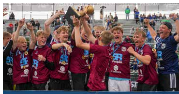
Winners B16 - HEI Håndbold 1