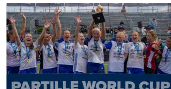
Winners G21 - Torslanda HK 2