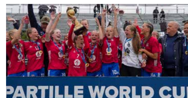
Winners G14 - Täby Handboll