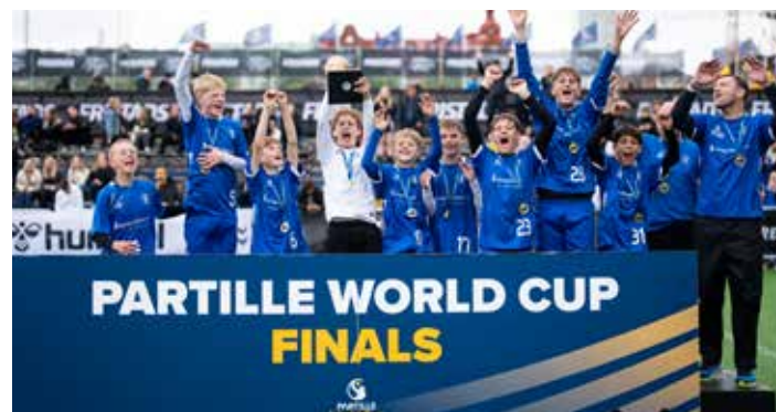
Winners B14 - IF Stjernen 1