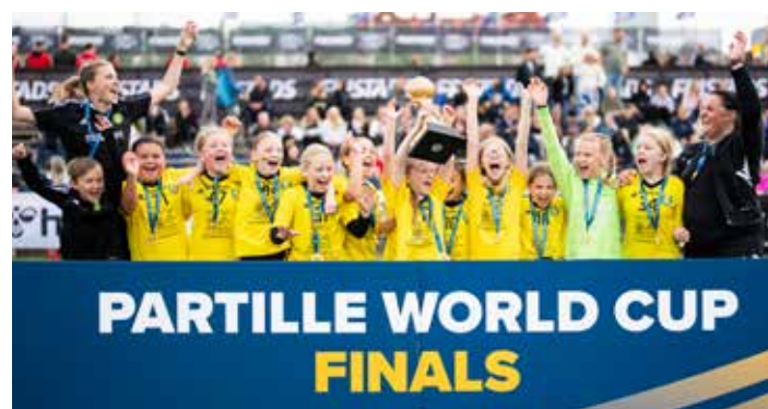
Winners G10 - IK Sävehof