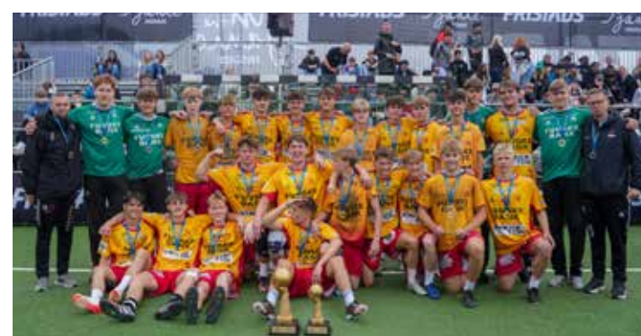
Winners B18 - GOG 1