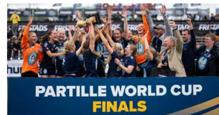
Winners G16 - AGF Aarhus