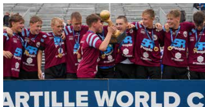
Winners B15 - HEI Håndbold 1