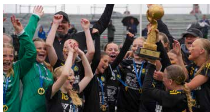
Winners G12 - IK Sävehof