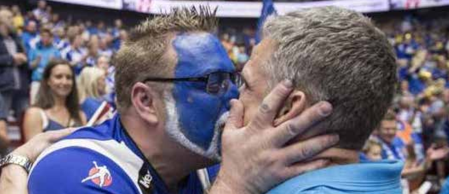
Det är mycket man får stå ut med som framgångsrik tränare