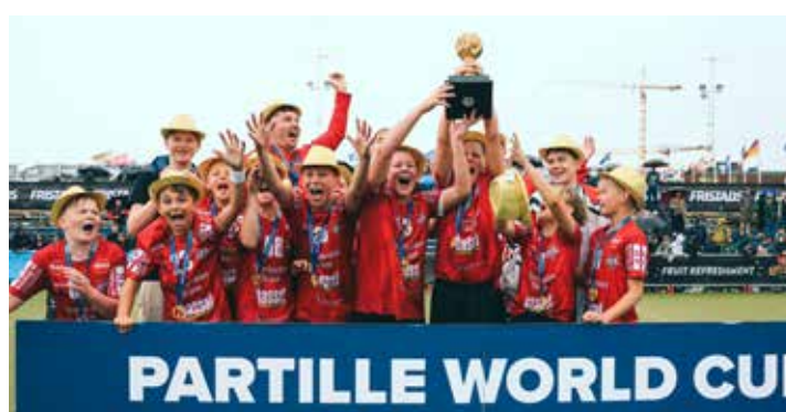
Winners B12 - IFK Ystad