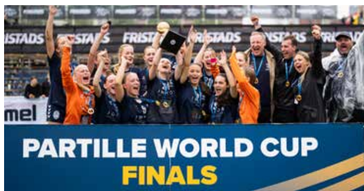
Winner G15 - AGF Aarhus