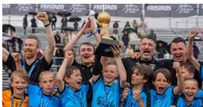
Winners B11 - Dunkerque HB Grand Littoral