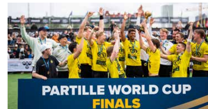
Winners B21 - IK Sävehof