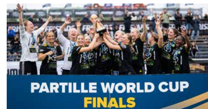
Winners G18 - IK Sävehof 1