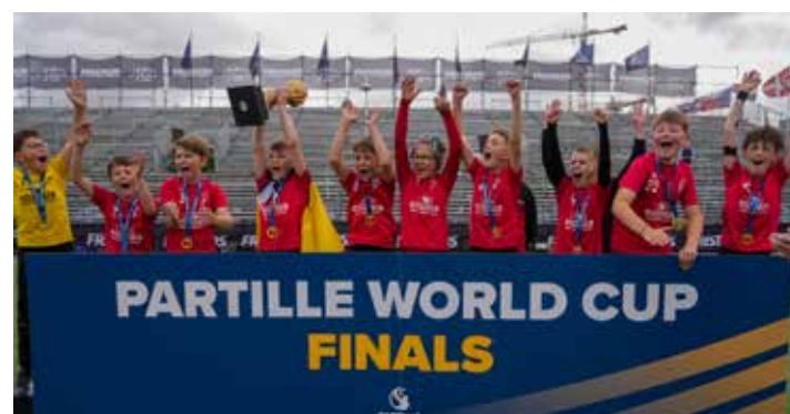
Winners B10 - HC Eynatten - Raeren 2